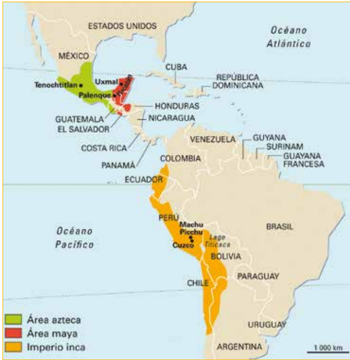
Territorios azteca, maya e inca.