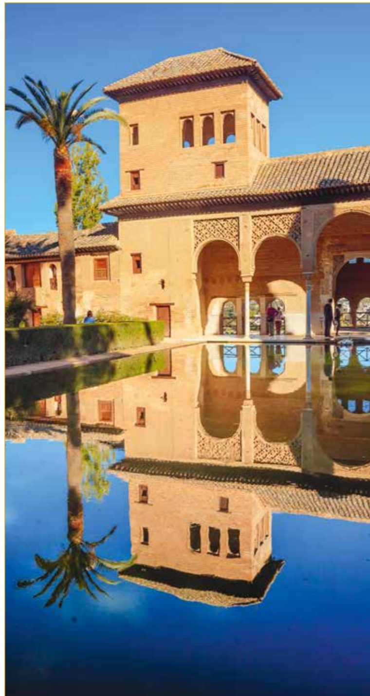
La Alhambra y sus jardines.

Además de sus funciones prácticas, el agua tenía, para los árabes, un valor espiritual: consideraban el agua como un «bien divino» que representaba la pureza, y edificaron baños destinados a cumplir funciones de higiene y de purificación.